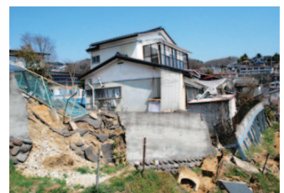
地盤崩落により傾いた住宅

表の通り仙台市内の宅地被害戸数は2,078戸にのぼります。この内、現在の宅地復旧関連事業の対象となるのは811戸に過ぎず、半数以上の1,267戸が、莫大な自己負担を強いられることとなります。